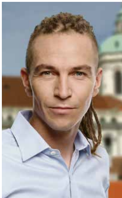
PhDr. Ivan Bartoš, Ph.D., předseda Pirátů

Senát je nedílnou součástí naší parlamentní demokracie a pojistkou