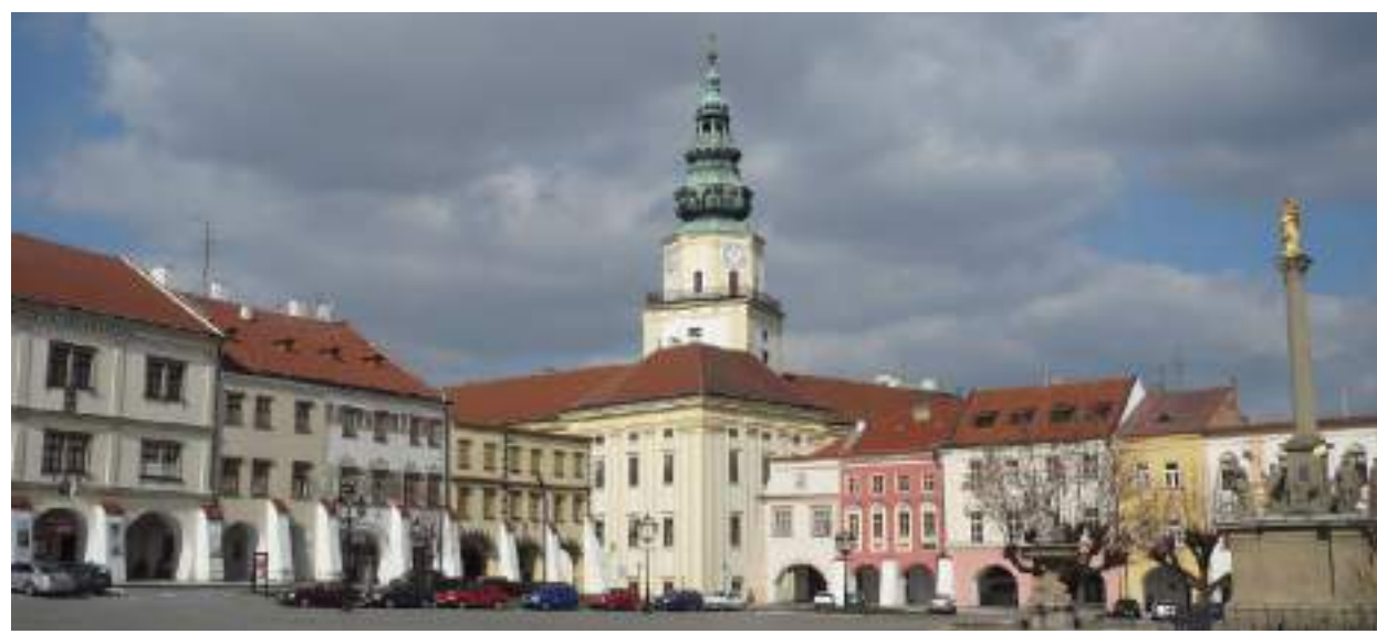
Autor: Czech Wikipedia user Marzper