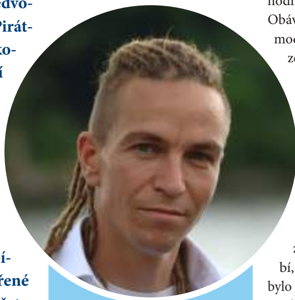
PhDr. Ivan Bartoš Ph.D.