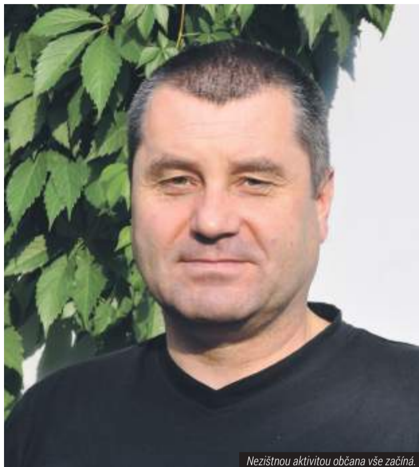
Nezištnou aktivitou občana vše začíná.

Tak jako vám, ani mně není lhostejné dění v Třeboni. Je pro mě důležitý budoucí pozitivní společenský a hospodářský vývoj města a jeho přidružených obcí. Cestou k všeobecné občanské prosperitě je, mimo jiné, transparentní komunální správa. Komunální politiku vnímám jako základní nástroj k prosazování občanských principů na řízení věcí veřejných. Osobní, věcnou, konstruktivní a zejména nezištnou aktivitou občana musí veškeré dění začínat. Občan by měl být nejvyšší autoritou a soudcem, který si ohlíká výsledek všech obecních aktivit. Tyto principy lze realizovat prostřednictvím vámi zvolených zástupců. Ucházím se o vaši důvěru a o možnost měnit věci k lepšímu.