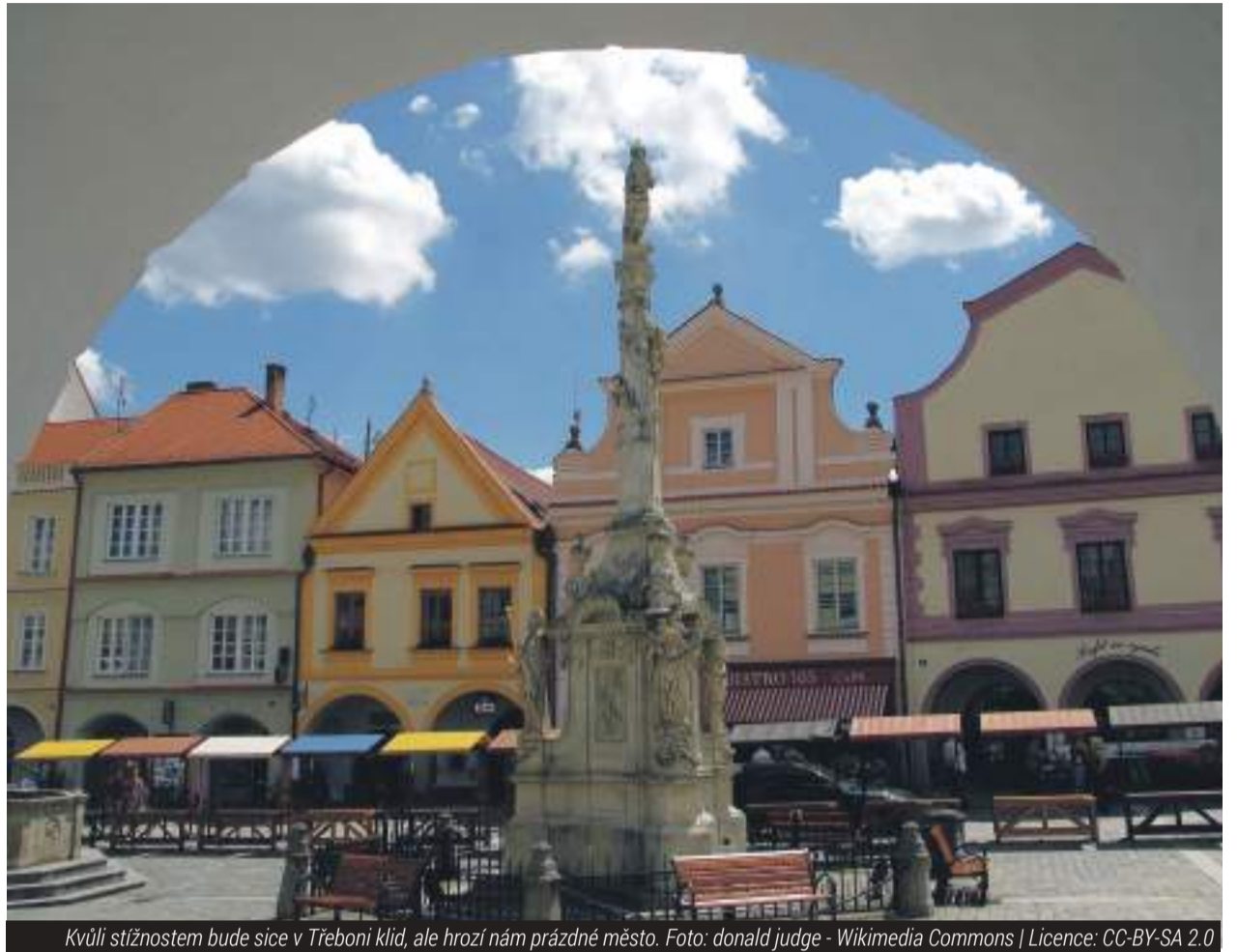
Kvůli stížnostem bude sice v Třeboni klid, ale hrozí nám prázdné město.

Okolo Třeboně – stížnosti, Anifilm – stížnosti, Třeboňský rynek – to samé (ukončen), Malý Mordechaj – stížnosti (ukončen) Plucarka – stížnosti (ukončeno)... Torpédo – stížnosti a konec, Herna – stížnosti a konec, Cuba libre – stížnosti a konec, Dada klub – stížnosti a konec, bar u Čerta – stížnosti a konec. Hospůdka u kola – stížnosti, o konci se už mluví pár let... Jediné, co tu zbývá, je Beseda, kterou město nezavře, neboť ji vlastní. Se stížnostmi se potýká neustále. Nedávno byl omezen provoz Kebab hausu do desáté hodiny. Patrně kvůli kuřákům na chodníku. Policie vám řekne: „Provozova-