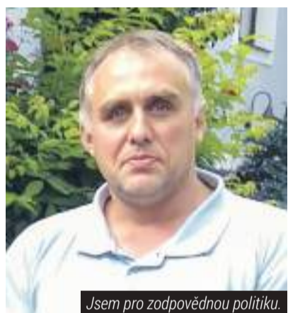
Jsem pro zodpovědnou politiku.

Není na škodu si zde připomenout, že v komunálních volbách jde vždy spíš o jména, než o stranickou příslušnost. Komu je sympatické nejsilnější vládní hnutí na národní úrovni, měl by počítat s tím, že na místní úrovni může být situace odlišná. Chod města totiž nebude řídit předseda hnutí, ani jeho místopředseda. Může se stát, že to bude někdo, koho znáte, kdo využil popularity módní značky, nemusí být ani členem hnutí a netvoří žádnou místní organizaci, odpovědnou za jejich rozhodování. s tím se nechci ztotožnit.