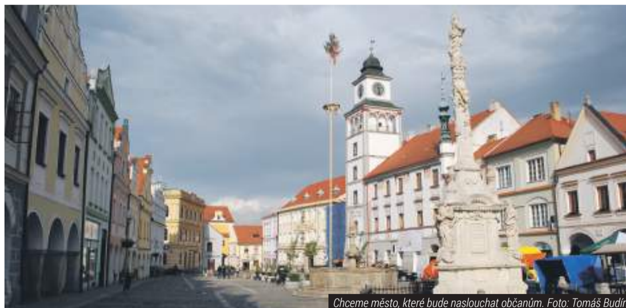
Chceme město, které bude naslouchat občanům.

Vytvořili kolem sebe klientelistické sítě a obsadili „svými“ lidmi klíčové pozice ve veřejných institucích (například úřadech, soudech, státních zastupitelstvích, policii a dalších). Tím si kromě klidu na odklání veřejných peněz státu a Evropské unie zajistili i beztrestnost před zákonem. Pomocí úplatků nebo výhrůžek si pak zavázali politiky ve všech stranách napříč spektrem. Pravo-levé rozdělení tak ztratilo smysl, protože kluci se stejně dohodli tak, aby něco „káplo“ každému. Občan se tím pádem smršknul na „věc“, která dostala jednou za čas iluzorní možnost volby a po zbytek volebního cyklu už ni-