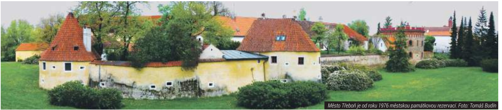
Město Třeboň je od roku 1976 městskou památkovou rezervací.