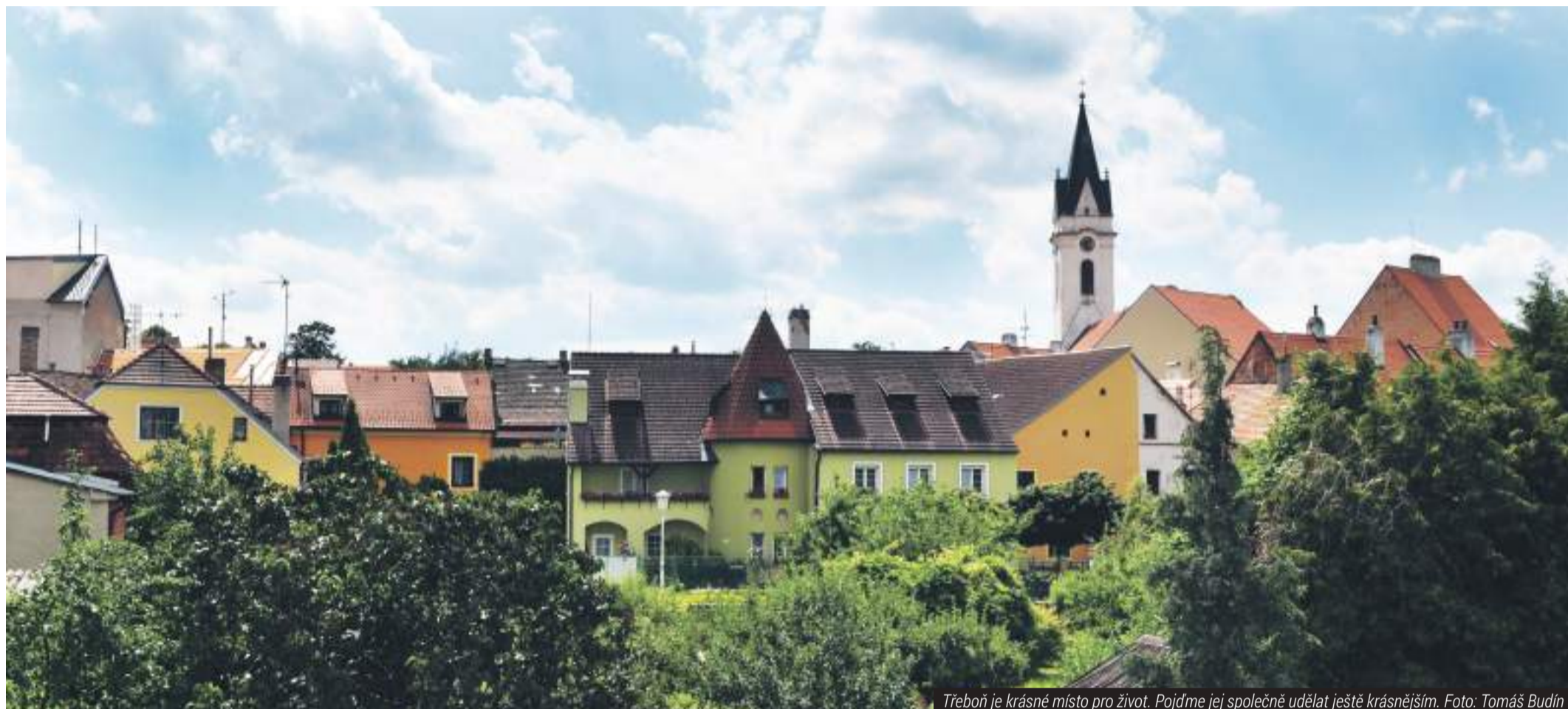
Třeboň je krásné místo pro život. Pojďme jej společně udělat ještě krásnějším.

Jiří Vopátek - Volby jsou příležitostí pro občany, aby vyjádřili své preference skrze volební programy kandidujících subjektů. Voliči vybírají své zástupce do zastupitelstva města s tím, že budou dbát potřeb občanů, hájit zájmy města v souladu se svým volebním programem. Zastupitelská role není po 12 letech osobních zkušeností v komunální politice jednoduchá. Některá témata spojují, jiná bohužel rozdělují. Práce v komunální politice je prací týmovou, nikoliv silovou, neboť je třeba umět naslouchat, zvažovat pro a proti, být zásadový, nebát se argumentovat a obhajovat i jiná než jednoduchá řešení. Také je potřeba umět uznat argumenty protistrany v rámci řešení konkrétního problému či oblasti.