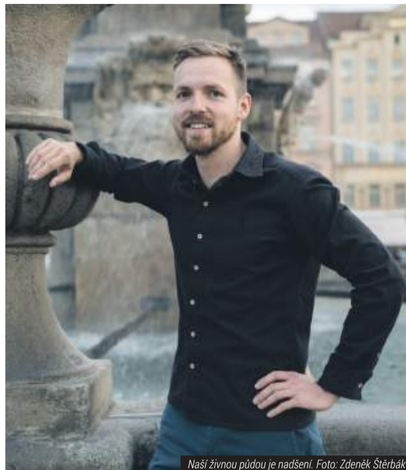
Naší živnou půdou je nadšení.

Milá maminko, vyříd' prosím své kamarádce, že Piráti se jmenujeme proto, že žádá ze stran, která má v názvu „demokratická“ se o skutečnou demokracii vůbec nezajímá. Piráti tohle slovo v názvu nemají a o to víc se demokratickými principy řídí. A až se Tě Tvá kamarádka zeptá, kdo nás platí, tak jí prosím pověz, že máme otevřené účetnictví na internetu a pokud jí to vážně zajímá, ať se podívá na