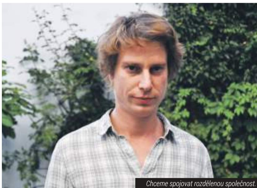
Chceme spojit rozdělenou společnost.

Česká společnost připomíná zadní část lidského těla. Ze všech stran slyšíme, že je rozdělená na dvě půlky. Každý si pak může vybrat, do které si kopne. Tyto dvě půlky však společně pohánějí jednu postavu. Ať se jim to líbí či nelíbí... Naším přáním je, aby toto tělo pohánělo společně kupředu.