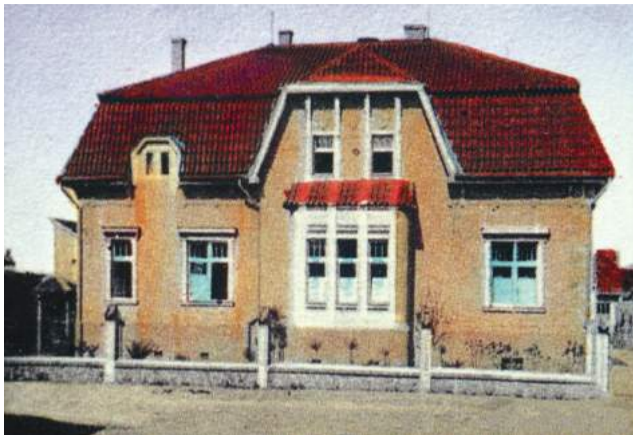
Molíkova vila vyobrazená na prvorepublikové pohlednici

Všichni známe pohled na již desetiletí se rozpadající a vyhořelou Molíkovu vilu (nazývanou také Červinkova vila) naproti městské knihovně. Její neudržovaná zahrada připomíná spíše džungli. Většina Soběslaváků však nezná historii, kdy neschopnost se domluvit a možná i touha po majetku jiných lidí zapříčinila její současný stav.