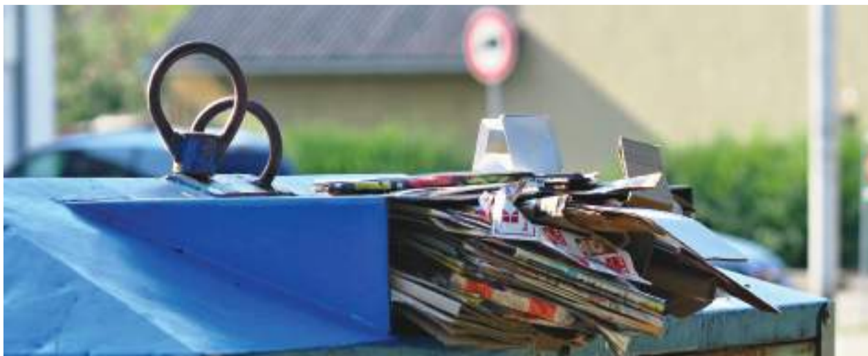
Přeplněné kontejnery na tříděný odpad na Sídlišti Svákov u Penny

Další možností je „Re-use“ neboli „opětovné využití“. Máte oblečení