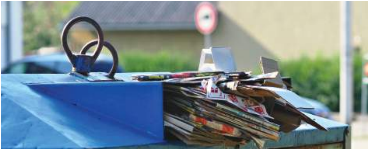
Přeplněné kontejnery na tříděný odpad na Sídlišti Svákov u Penny

Další možností je „Re-use” nebo-li „opětovné využití”. Máte oblečení