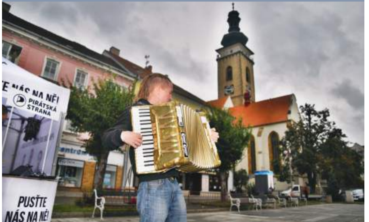
Předseda Pirátské strany Ivan Bartoš si při loňské návštěvě Soběslavi zahrál na náměstí Republiky na harmoniku

Piráti pro Soběslav se možná stali obětí politické šikany