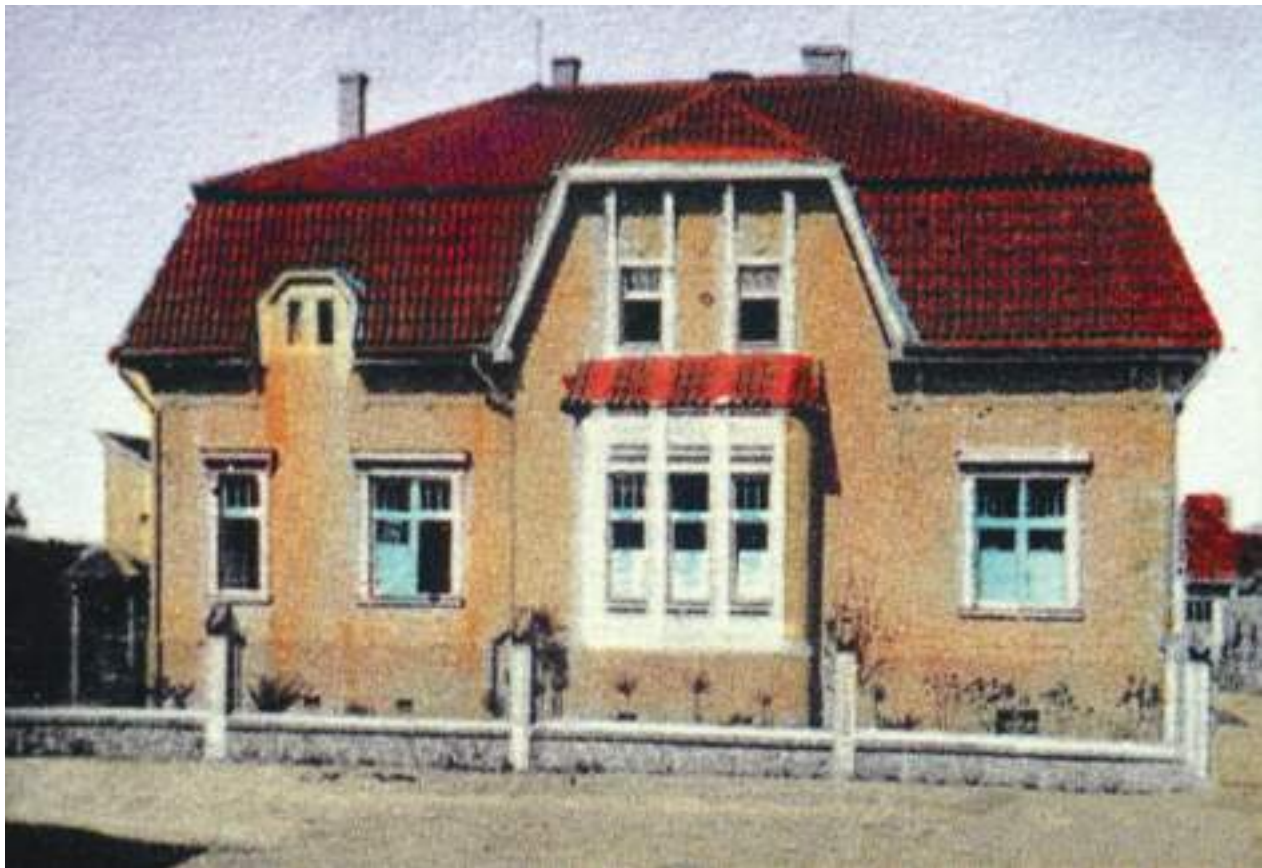
Molíkova vila vyobrazená na prvorepublikové pohlednici

Všichni známe pohled na již desetiletí se rozpadající a vyhořelou Molíkovu vilu (nazývanou také Červinkova vila) naproti městské knihovně. Její neudržovaná zahrada připomíná spíše džungli. Většina Soběslaváků však nezná historii, kdy neschopnost se domluvit a možná i touha po majetku jiných lidí zapříčinila její současný stav.