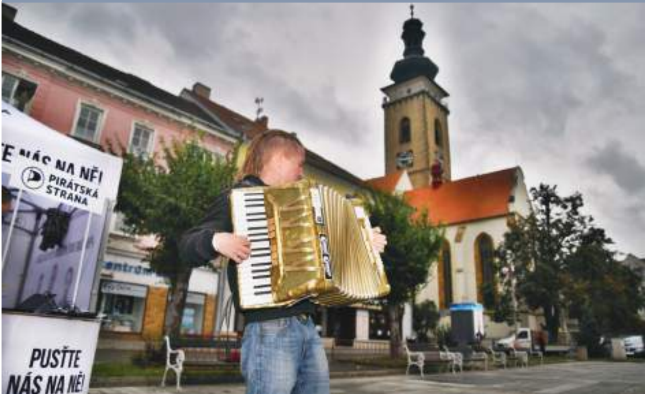
Předseda Pirátské strany Ivan Bartoš si při loňské návštěvě Soběslavi zahrál na náměstí Republiky na harmoniku

Předseda Pirátů a poslanec za Středočeský kraj Ivan Bartoš v minulých letech již několikrát navštívil Soběslav. Naposledy dorazil s vězeňským autobusem podpořit Piráty pro Soběslav s jejich peticí za architektonické řešení centra města. Nyní jsme mu položili několik otázek.