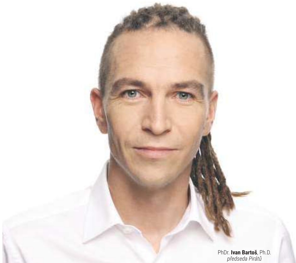
PhDr. Ivan Bartoš , Ph.D. předseda Pirátů

„Není možné, aby politik vykonával několik funkcí na plný úvazek a za každou dostával plnohodnotný plat,” říká předseda České pirátské strany Ivan Bartoš v předvolebním rozhovoru pro Pirátské listy. V blízkých se komunálních volbách věří v úspěch, cílem je obhájit pirátské bašty jako jsou třeba Mariánské Lázně, posílit pirátskou posádku na brněnském magistrátu a zvítězit v Praze. Piráti jsou podle Bartoše jediní, kteří nabízejí lidem opravdu otevřené radnice a fungující město. „Občan, který může kdykoli zajít na radnici za „svým“ politikem, to má být cíl komunální politiky,” dodává. Máte za sebou deset měsíců působení ve Sněmovně. V létě vznikla vláda s podporou komunistů. Jak se na ni díváte a mění to nějak politické cíle Pirátů?