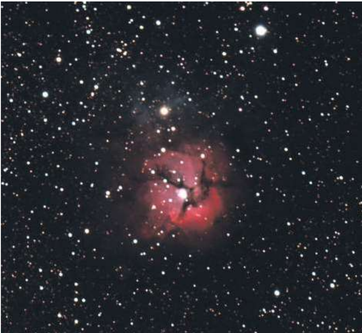
Mlhovina v souhvězdí Střelce zvaná „Trifid“