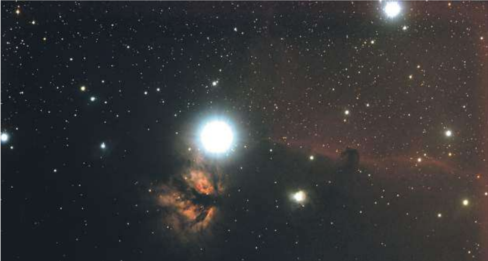
Oblak mlhoviny Koňská hlava v souhvězdí Orion

V dosahu malých dalekohledů i pouhého oka jsou jednak plane-ty Sluneční soustavy, jednak další tělesa, která do ní patří: asteroidy, komety, Měsíc se svým fascinujícím povrchem, meteory, ale třeba i Sluneční skvrny. Pokud se trochu zamyslíme nad dynamikou těchto těles, řeknou nám mnoho o tom, jak