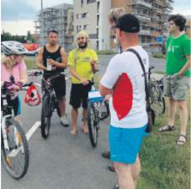
Uspořádali jsme cyklovýježdku po developerských projektech

Jednoznačně tím stát dal přednost finančním prostředkům před zdravím lidí. Přitom vybudování protihlukové stěny je v nákladech na dálnici zanedbatelná položka. Proto jsem iniciovala petici za snížení hluku z dopravy a v Senátu budu iniciovat změnu zákona, aby takové změkčení limitů poškozující lidské zdraví nebylo možné. O škodlivosti hluku se vyjádřil i pirátský kandidát na primátora, lékař Zdeněk Hřib.