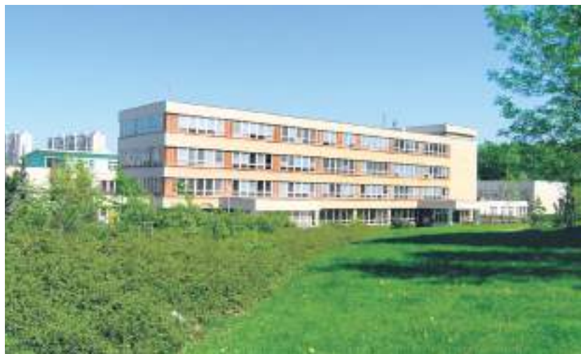
ZŠ Angelovova

Podobně bychom rádi rozšířili počet mateřských školek s alternativním výukovým programem. V současné době u nás funguje MŠ Montessori s programem Montessori, MŠ Hasova, Pastelka, Srdíčko a Větrníček pak nabízí program Začít spolu, MŠ Podsaďáček vychází z programu Zdravá škola. I v tomto případě bychom rádi zvětšili rozmanitost školních programů tak, aby si rodiče mohli pro své děti lépe vybrat. Dnes víme, že vzdělání je důležitější víc než kdykoliv v minulosti a právě alternativní školní programy mohou dětem školu nezprotivit už v útlém věku, udržet jejich přirozenou zvědavost a připravit je na změny, které svět v dalších letech čekají.