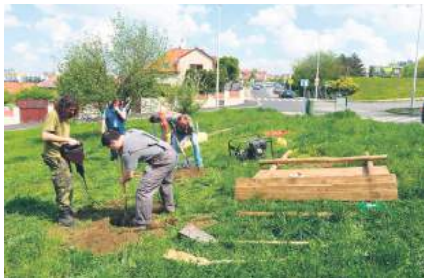
Výsadba jabloňového sadu na Násirově náměstí

Dřeviny rostoucí mimo les jsou letitými svědky naší historie, nás samých a kloubí v sobě produkční, estetické, zdravotně-hygienické a environmentální funkce. Obnova alejí podél cest, ale i vztah k půdě a dodržování správné zemědělské praxe na ní by měly být v zájmu nejednoho z nás, obzvlášť pokud chceme žít v souladu se zásadami trvale udržitelného rozvoje. Krajina, kterou můžeme spatřit v naší městské části, je svědkem odvěké kultivace našich předků. Jejich vlastníci nesou plnou odpovědnost za to, jak s ní hospodaří. Některé neuvážené kroky, jako je např. zábor zeměděl-