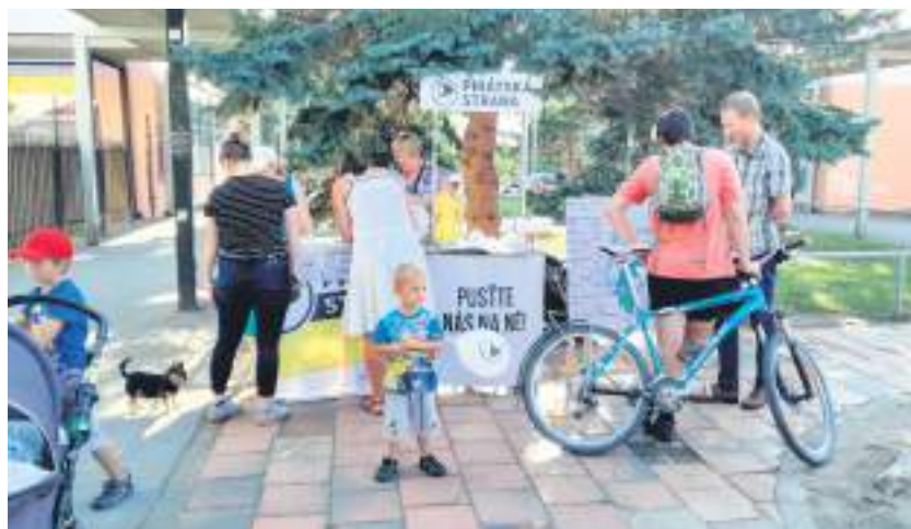
Objížděli jsme Prahu 12 s infostánkem s připomínkami k metropolitnímu plánu

Hluk z dopravy trápí obyvatele nejen Komořan. Zdrojem hluku jsou dopravní stavby v jejich okolí. V některých oblastech se dokonce hluk počítá z několika dopravních staveb. Nejhorší je hluk v nočních hodinách, když začnou jezdit kamiony a budí lidi ze spaní. Na pražském silničním okruhu dosud nejsou realizována všechna protihluková opatření, která jsem v roce 2000 jako náměstkyně ministra životního prostředí požadovala ve stanovisku posuzování vlivů na životní prostředí. Podařilo se mi ze znalostí místa prosadit, aby okruh mezi Cholupicemi a Točnou