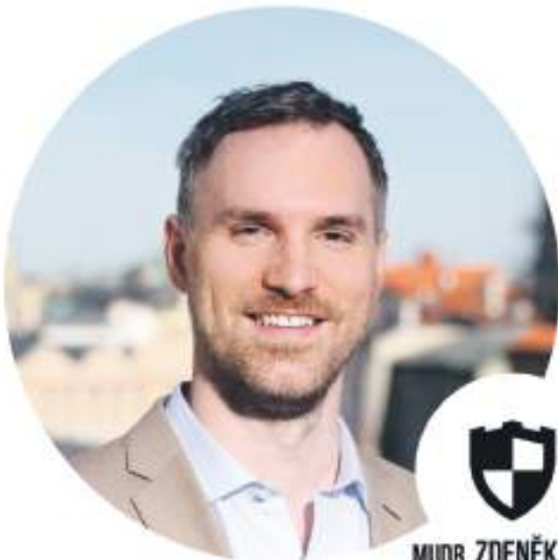
MUDR. ZDENĚK HŘIB manažer a informatik kandidát na primátora hl. m. Prahy