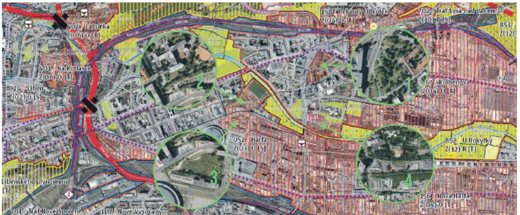
Zobrazení Metropolitního plánu s vyznačenými oblastmi: 1 – Náměstí OSN, 2 a 3 – Parčíky mezi O2 arénou a CLINICUM, 4 – Břehy Rokytky u Rezidence Eliška

Petr Karel, technický konzultant, kandidát Pirátů na Praze 9