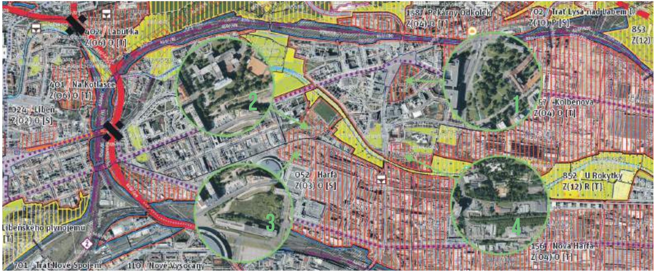
Zobrazení Metropolitního plánu s vyznačenými oblastmi: 1 – Náměstí OSN, 2 a 3 – Parčíky mezi O2 arénou a CLINICUM, 4 – Břehy Rokytky u Rezidence Eliška

Petr Karel, technický konzultant, kandidát Pirátů na Praze 9