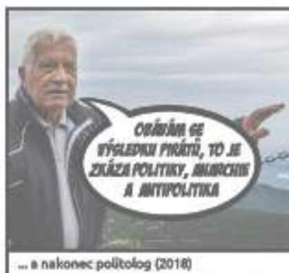
... a nakonec politolog (2018)

PIRÁTSKÁ STRANA Piráti uvádí komiks: Mnoho talentů Václava Klause