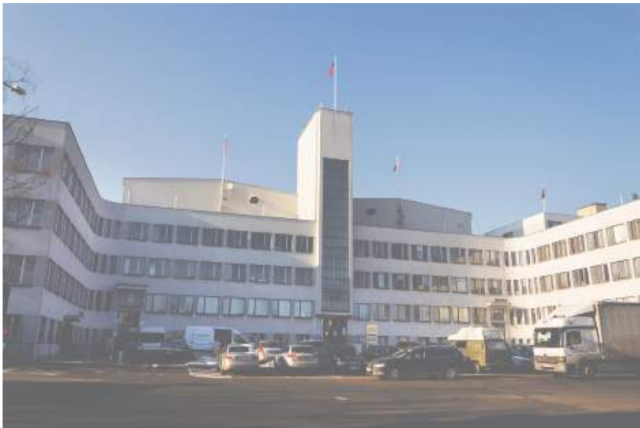
Filmové ateliery Barrandov (ilustrační foto)

S polek na ochranu Barrandova se loni úspěšně postavil proti projektu výstavby nepřiměřeně velkých domů ve Filmařské ulici a stejně úspěšně zasáhl v Barrandovské ulici. V ulici Skalní byla sice chráněná historická vila zbourána, ale územní rozhodnutí na výstavbu 4 bytových domů je zrušeno. V řízení o odstra-