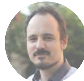
MGA. ADAM RUT Otevřená radnice a kultura

„Atraktivita Prahy 5 svádí k vytěžování hodnoty pozemků bezohlednou výstavbou zhoršující kvalitu života v nejbližším okolí. Sousedé pak prodlužují stavbu nekonečnými obstrukcemi ve stavebním řízení. Proto přinutíme developery, aby respektovali okolí stavby již v předchozích projektových stupních. Radnice v tom dosud byla slabá.“