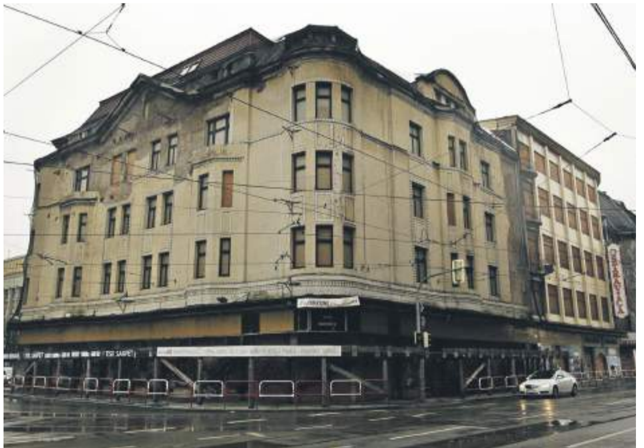
Zchátralý komplex Ostravica Textilia

Propojení kultury, umění, architektury a urbanismu předpokládá citlivý a zodpovědný přístup k historickému centru Ostravy. Proto je naprosto nezbytné zapojit do jeho utváření jeho obyvatele, odborníky, zájmové spolky a iniciativy. Nejdůležitější je ovšem politická vůle veřejný prostor rozvíjet tak, aby splňoval nároky na funkčnost i estetiku. Dosud jsme svědky spíše dílčích pokusů než ucelené koncepce oživení veřejného prostoru. Ostrava jako město, kde před více než 100 lety působil slavný rakouský architekt a urbanista Camillo Sitte navrhuující smysluplně koncipovaný veřejný prostor, by měla mít ambice na tento odkaz