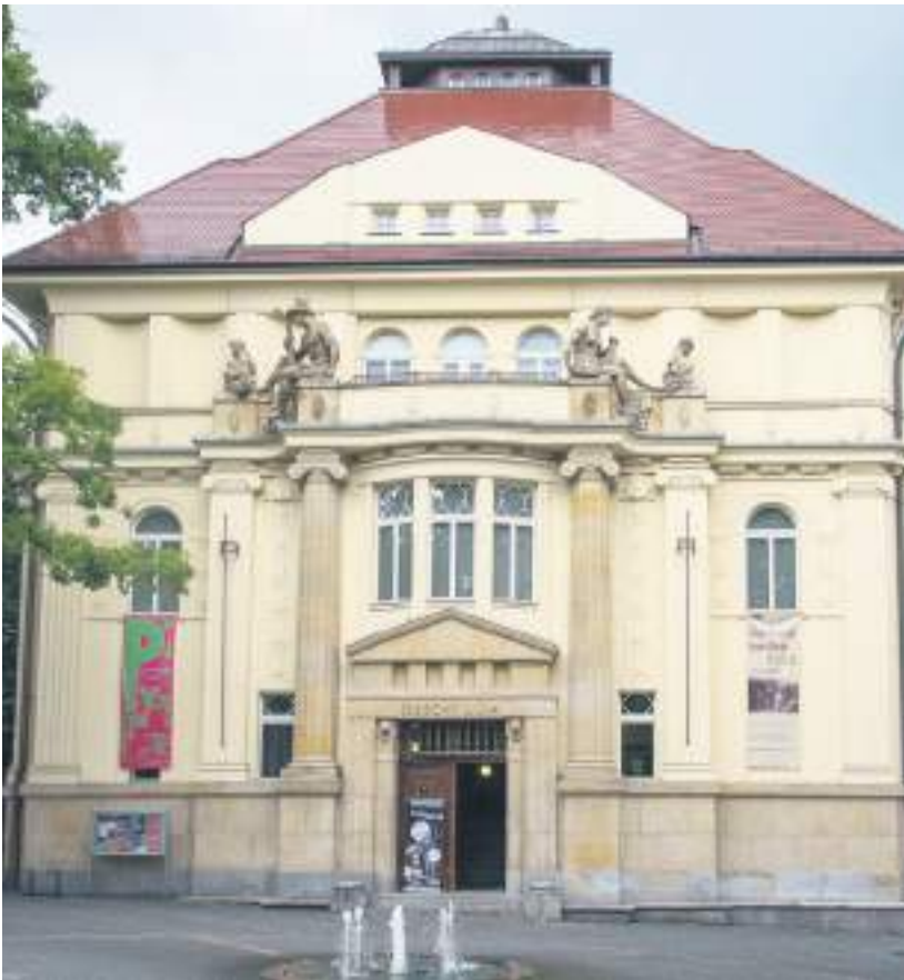
Opavská kulturní organizace – Obecní dům Opava