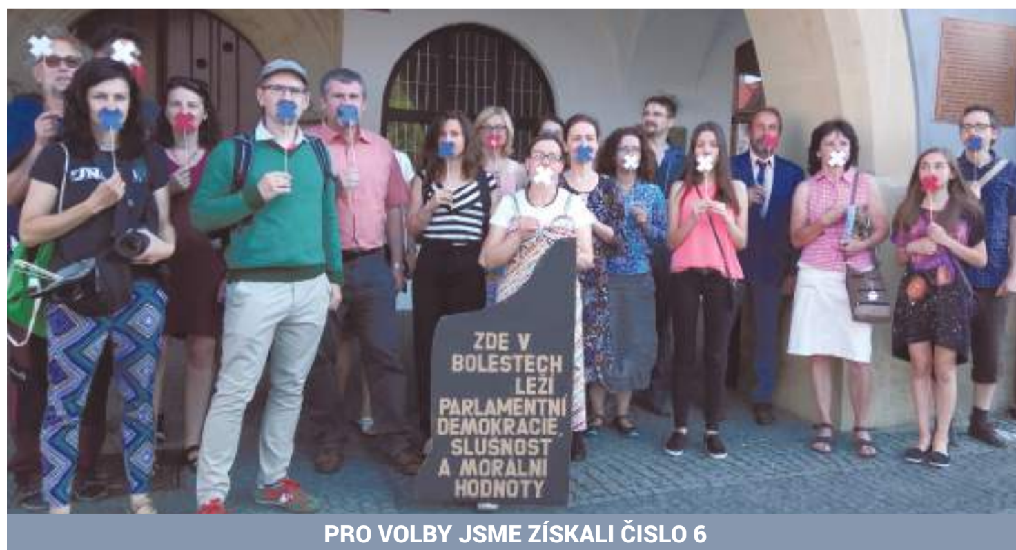
PRO VOLBY JSME ZÍSKALI ČÍSLO 6