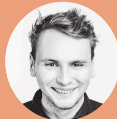
AUTOR: JOSEF KUBÁT

Úzký kontakt institucí, odborníků, politiků a hlavně uživatelů služeb je nejschůdnější cestou k řešení všech legislativních problémů. Město Klatovy se v budoucím plánování rozvoje města musí více zaměřit na dostupné byty a tzv. chráněné bydlení, také by pomohlo navýšení rozpočtových kapitol na konkrétní terénní sociální pracoviště.