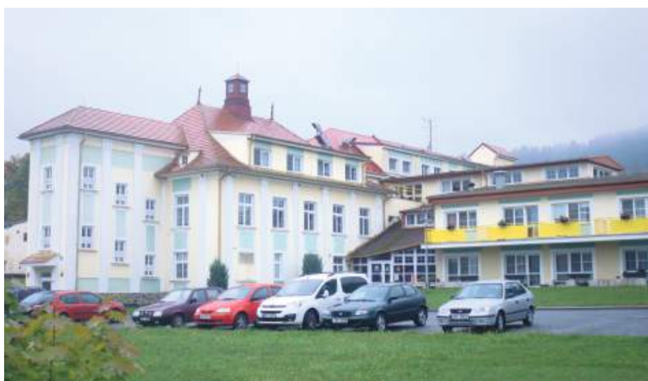
Domov pro seniory v Újezdci.

„Samotná práce s klienty bývá někdy komplikovaná a záleží na jejich ochotě spolupracovat a řešit svoji nepříznivou sociální situaci. Pomoc sociálních služeb vychází z individuálně určených potřeb osob, musí uživatele služeb motivovat k tomu, aby nevedly k dlouhodobému setrvávání nebo prohlubování nepříznivé sociální situace, a posilovat jejich sociální začleňování. Dávky, které pobírají k překonání složité životní situace však nejsou zadarmo a musí se starat sami, aby splnili podmínky na výplatu. Klienti uzavírají smlouvu s MěÚSS včetně individuálního plánu na řešení jejich nepříznivé sociální situace. Ne vždy však dopadne spo-