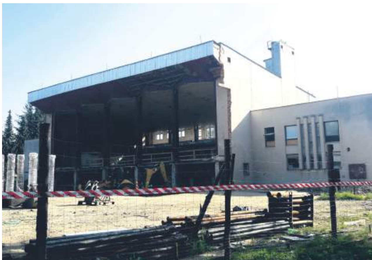
Domažlický bazén. Rekonstrukce za bezmála 300 miliónů korun.