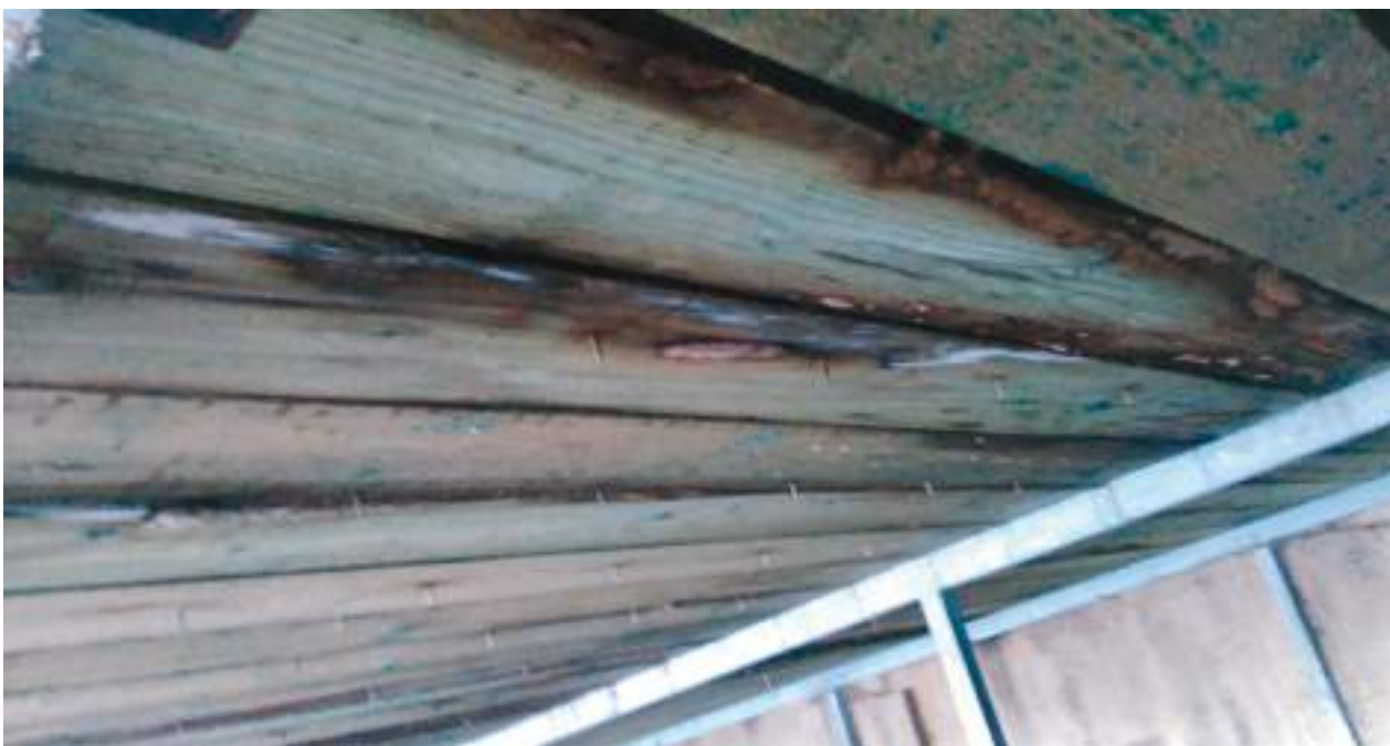
“Profesionálně opravená překážka” společností KV CITY