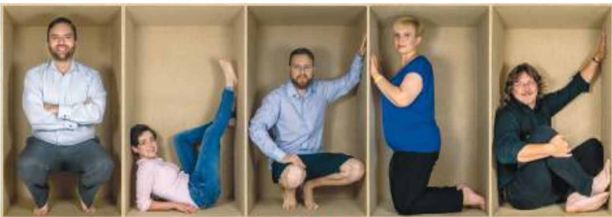
Známe lepší Varyantu!

Piráti jdou poprvé samostatně do voleb také v Karlových Varech. Voličům nabízí plnou kandidátku 35 žen a mužů, kteří by rádi dopomohli svému městu k lepší budoucnosti. Do voleb jdou s pokorou, ale také s vědomím, že znají lepší Varyantu!