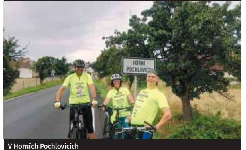
V Horní Pochlovicích