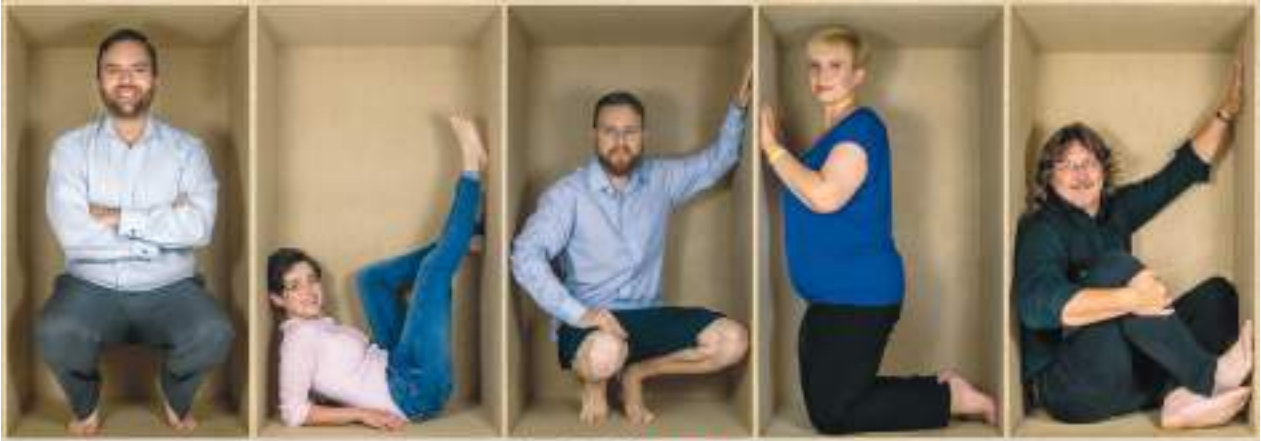
Známe lepší Varyantu!

Piráti jdou poprvé samostatně do voleb také v Karlových Varech. Voličům nabízí plnou kandidátku 35 žen a mužů, kteří by rádi dopomohli svému městu k lepší budoucnosti. Do voleb jdou s pokorou, ale také s vědomím, že znají lepší Varyantu!