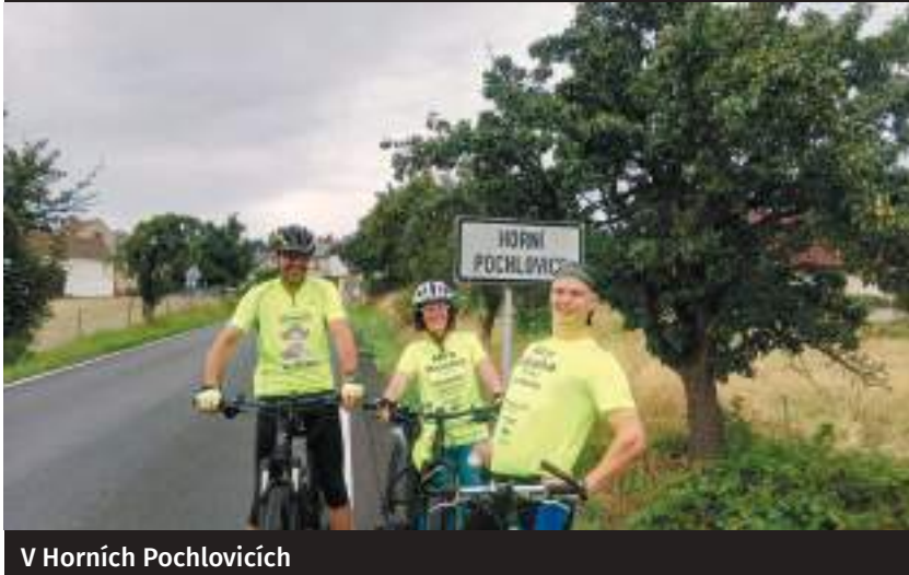
V Horních Pochlovicích