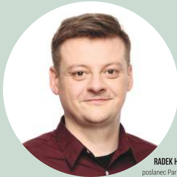
RADEK HOLOMČÍK poslanec Parlamentu ČR za Piráty

Mgr. Radek Holomčík (*31. července 1985 v Hodoníně) pochází ze Strážnice. Vystudoval SPŠ v Uherském Hradišti, obor Elektrotechnika. Po střední škole začal pracovat v oboru, přičemž se neúspěšně pokoušel o studium astrofyziky a politologie. Po dvou letech se přeorientoval na oblast marketingu a PR, ve které pracuje dodnes. Při zaměstnání vystudoval Teorie interaktivních médií (Bc.) a Management v kultuře (Mgr.), obě na FF MU v Brně. V lednu 2018 byl zvolen za 2. místopředsedu Pirátů.