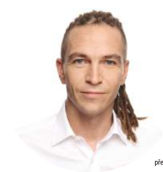
IVAN BARTOŠ předseda České pirátské strany