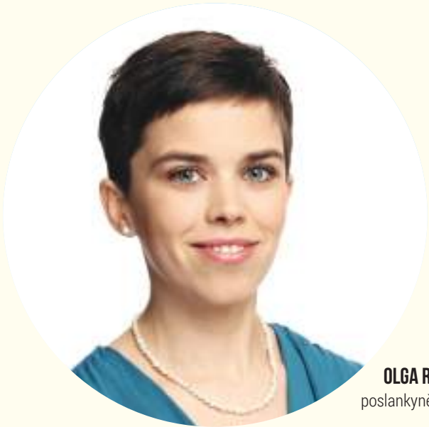
OLGA RICHTEROVÁ poslankyně Parlamentu ČR za Piráty

PhDr. Olga Richterová Ph.D. (*21. ledna 1985) je poslankyně České pirátské strany, místopředsedkyně výboru pro sociální politiku a členka výboru pro zdravotnictví. Olga vystudovala překladatelství a tlumočnictví (AJ-NJ) na Karlově univerzitě v Praze, kde získala titul Ph.D. V průběhu studia pobývala v Německu a Anglii, domluví se též rusky a italsky. Kompostuje, ráda běhá a je zastupitelkou na Praze 10. Je vdaná a má dvě malé děti, žije ve Vršovcích a pochází z Choltic u Pardubic.