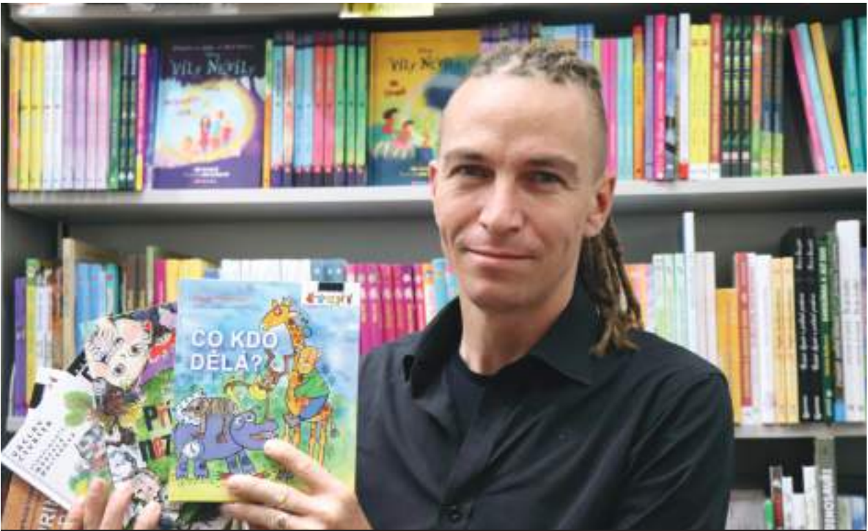
Ivan Bartoš představuje kampaň na podporu sociálně znevýhodněných dětí z kladenského předškolního zařízení Vějíř (ilustrační fotografie)

Samozřejmě, že výše uvedené obtíže mohou rodiče vhodným výchovným působením eliminovat, ale uvědom-