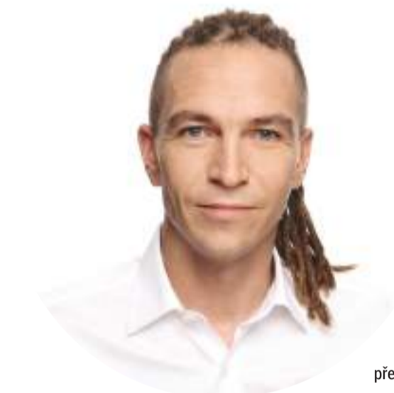
IVAN BARTOŠ předseda České pirátské strany

“Není možné, aby politik vykonával několik funkcí na plný úvazek a za každou dostával plnohodnotný plat,” říká předseda České pirátské strany Ivan Bartoš v předvolebním rozhovoru pro Pirátské listy. V blízkých se komunálních volbách věří v úspěch, cílem je obhájit pirátské bašty jako jsou třeba Mariánské Lázně, posílit pirátskou posádku na brněnském magistrátu a zvítězit v Praze. Piráti jsou podle Bartoše stranou, která nabízí lidem opravdu otevřené radnice a fungující město. “Občan, který může kdykoli zajít na radnici za „svým“ politikem, to má být cíl komunální politiky,” dodává.