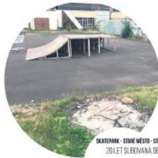
SKATEPARK - STARÉ MĚSTO - STRÁNKOVÁ STRA 20 LET SLIBOVANÁ OBNOVA

VYTVOŘME DŮSTOJNÉ MÍSTO PRO SETKÁVÁNÍ MLADÝCH SPORTOVČŮ A RODIN S DĚTI