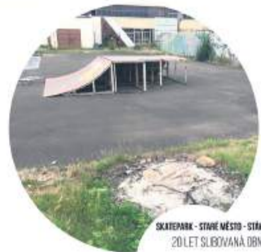
SKATEPARK - STARÉ MĚSTO - STRÁNKOVÁ STRA 20 LET SLIBOVANÁ OBNOVA

VYTVŮRME DŮSTOJNÉ MÍSTO PRO SETKÁVÁNÍ MLADÝCH SPORTOVČŮ A RODIN S DĚTI