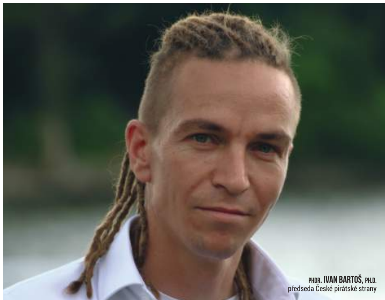
PHDR. IVAN BARTOŠ, PH.D. předseda České pirátské strany