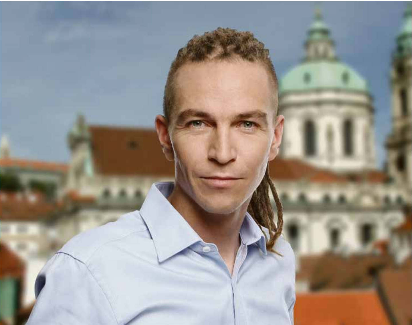
PhDr. Ivan Bartoš, Ph.D.