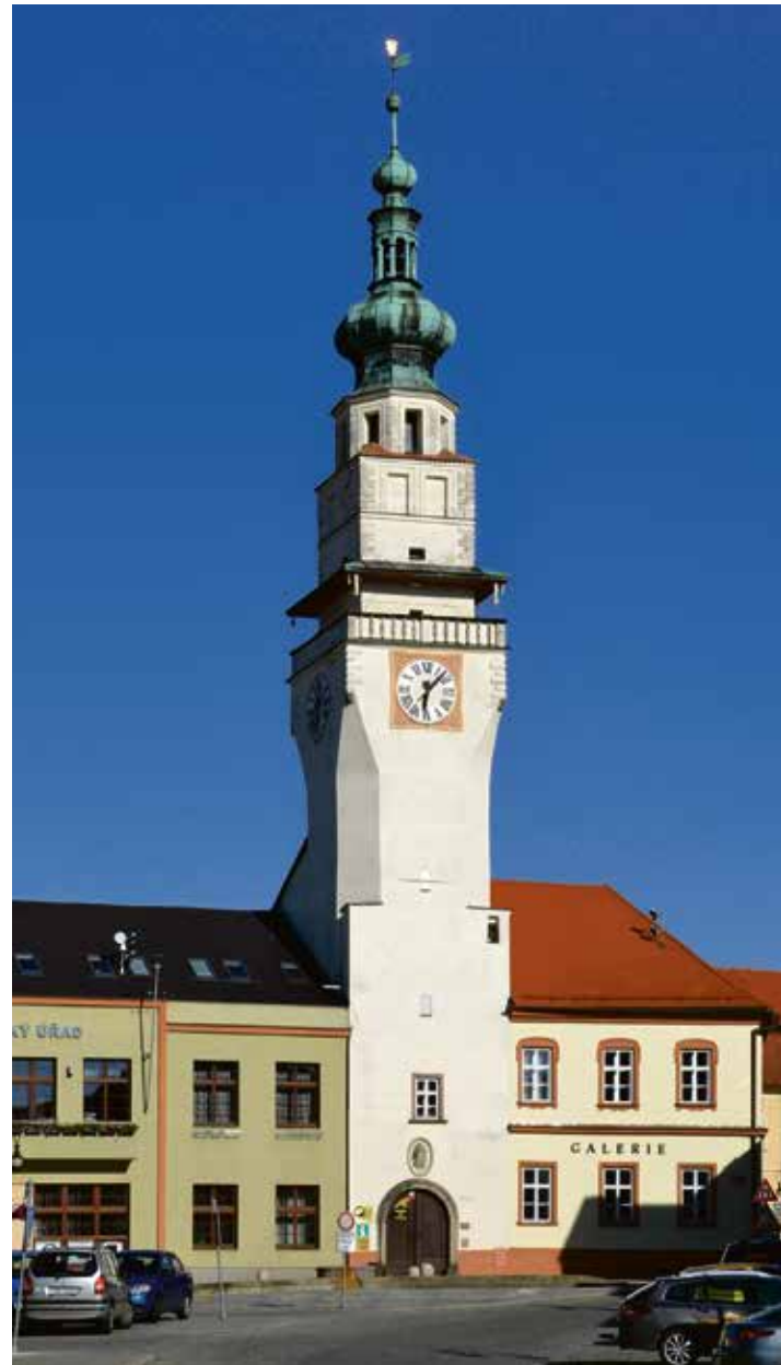
Boskovice – radnice