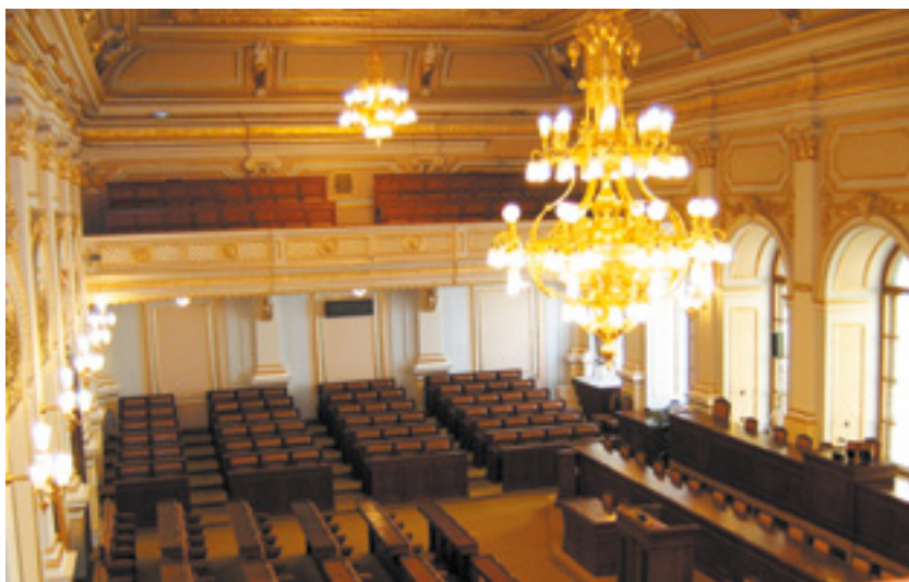
Poslanecká sněmovna Parlamentu České republiky