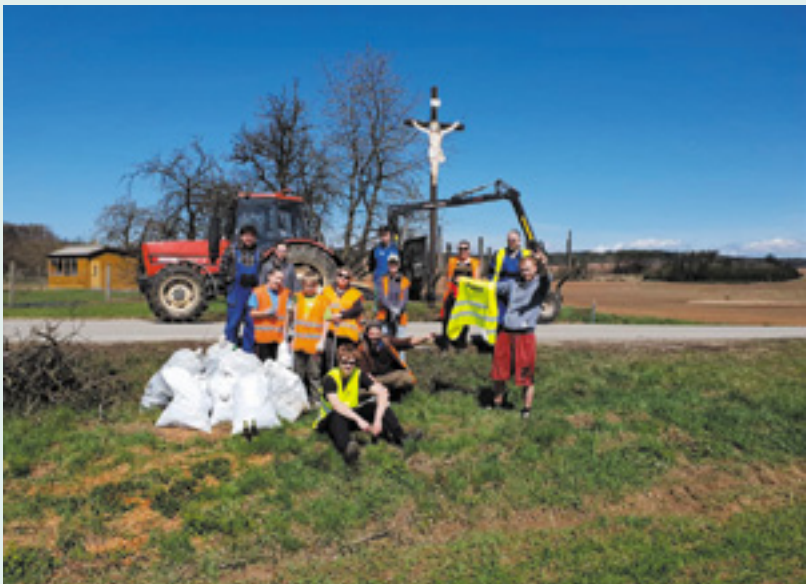
Úklid v obci Lhotice

Vážně. I ten nejmenší Pirát už zjistil, že odpady smrdí a špatně se v nich pluje. Proto se Piráti po celé Vysočině připojili k dalším dobrovolnickým posádkám projektu Uklidme svět, uklidme Česko 2018. Nalodili i své příznivce a další suchozemce a společně vypluli zatočit s černými skládkami a nepořádkem všeho druhu.