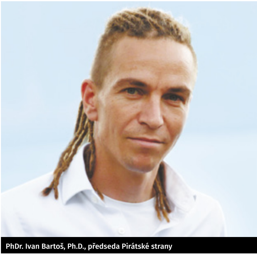
PhDr. Ivan Bartoš, Ph.D., předseda Pirátské strany