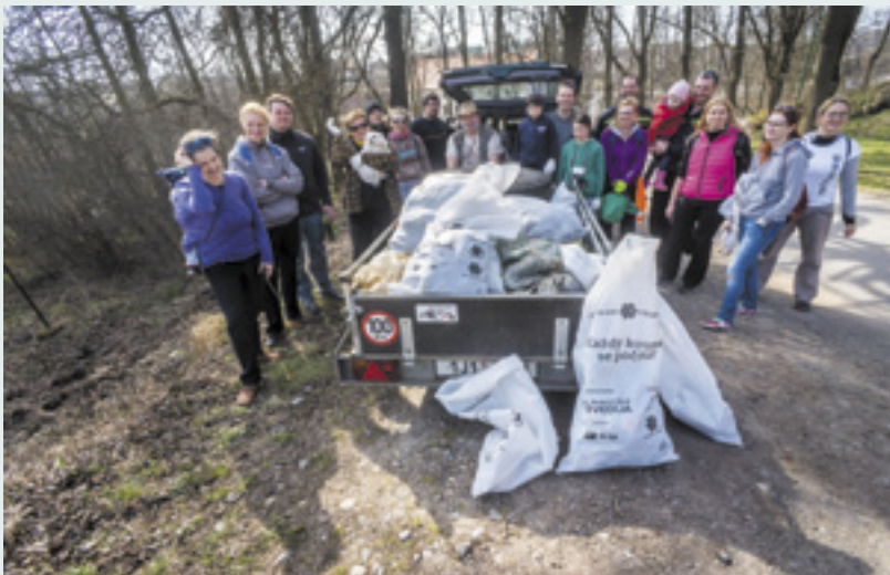
Sesbíráno více než 13 pytlů odpadu

Piráti a úklid? Vážně? Vážně. I ten nejmenší Pirát už zjistil, že odpadky smrdí a špatně se v nich pluje. Proto se Piráti po celé Vysočině připojili k dalším dobrovolnickým posádkám projektu Uklidme svět, uklidme Česko 2018. Nalodili i své příznivce a další suchozemce a společně vypluli zatočit s černými skládkami a nepořádkem všeho druhu.