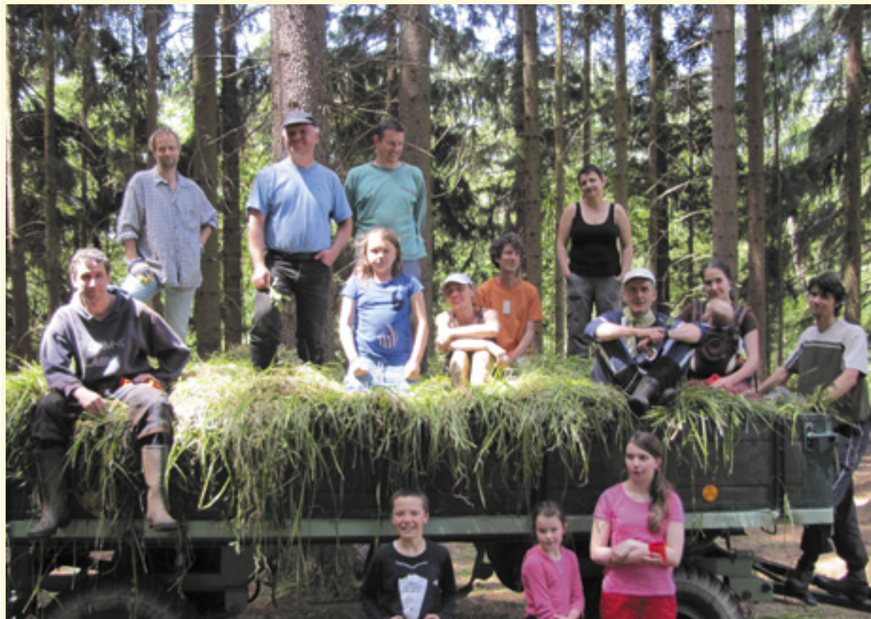
Kosení rašelinné loučky u rybníka Horní Mrzatec

V sobotu 23. června se již posedmé sejeme na tradičním kosení rašelinné loučky u rybníka Horní Mrzatec, které pořádá telčský Spolek Javořice. Zapojit se může každý, kdykoli, od rána do odpoledne. Kromě kosení budeme nahrabovat, odnášet a nakládat na valník posečenou trávu, likvidovat nálet a obnovovat odvodňovací stružky. Těšit se můžete i na opékání klobásek na ohni a koupání v rybníce.