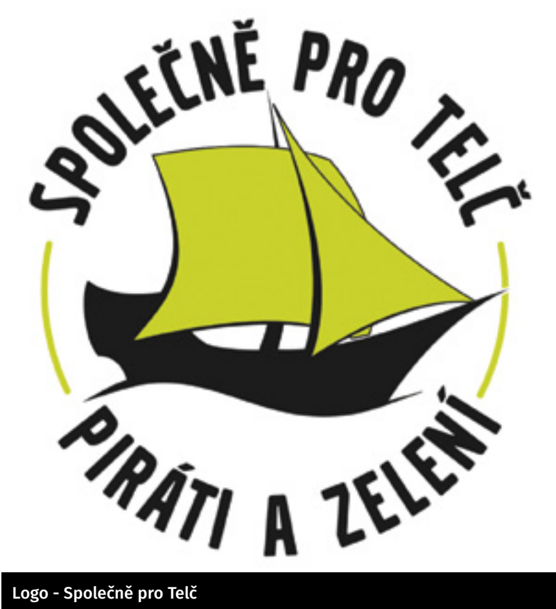
Logo - Společně pro Telč