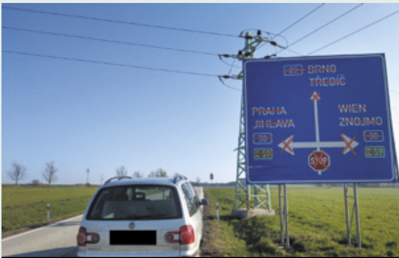
Tudy opravdu neproplujete

I v letošním roce se v okolí Telče chystá několik velkých oprav místních komunikací a silnic. Asi největší ohlas vzbudila oprava nebezpečné křižovatky u Markvartic. Díky přeškrtnuté dopravní značce se baví uživatelé sociálních sítí po celém Česku.