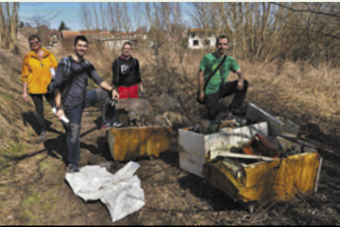
2018 - Remízek u nádraží ukrýval 6 lednic