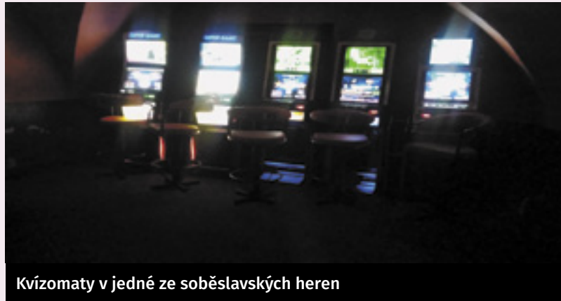
Kvízomaty v jedné ze soběslavských heren

Minulý rok vstoupila v platnost nová vyhláška o provozování hazardních her v Soběslavi. Došlo k omezení míst, kde je možno legálně hazard provozovat, na jediné místo, kterým je herna Paluba. Piráti pro Soběslav přišli s vlastním návrhem obecně závazné vyhlášky na nulovou toleranci hazardu.