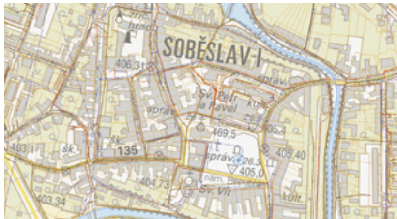
Ukázka digitální mapové aplikace Jihočeského kraje

Digitální technická mapa obsahuje základní geografická data, která jsou využívána při správních a rozhodovacích činnostech města. Navrhli jsme, aby data byla dostupná i pro veřejnost. Mohli byste online prohlížet územní plán města a podívat se,