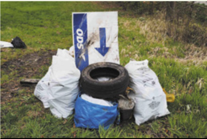
2017 - Odpadky z rokle pod silnicí na Vesce