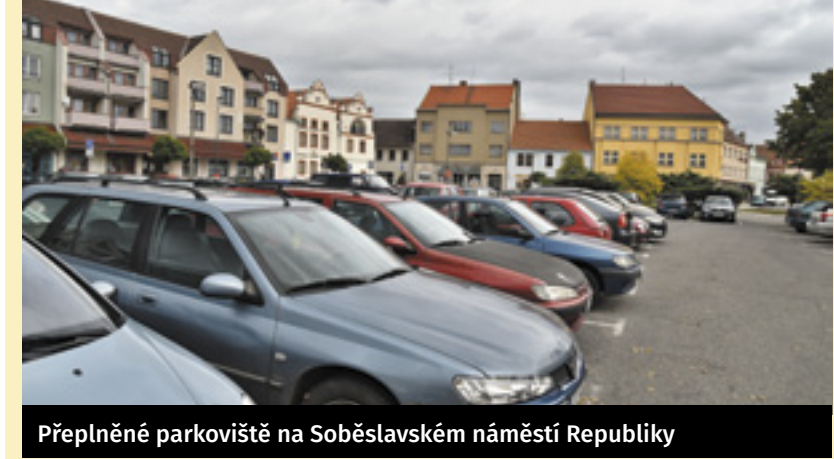
Preplněné parkoviště na Soběslavském náměstí Republiky

Na podzim Pirátí pro Soběslav vytvořili anketu na téma dopravy a roznesli ji do schránek po celém městě. Celkem se vrátilo přes 150 vyplněných dotazníků, které jsme zanalyzovali a předali vedení města. Z výsledků ankety vyplynulo, že více než polovina respondentů by ocenila časově omezené parkování v centru a s rezidentními kartami by souhlasilo 68% účastníků. Kompletní výsledky najdete na pirati.sobeslav.cz/anketa nebo ve výloze v ulici Petra Voka naproti poliklinice.