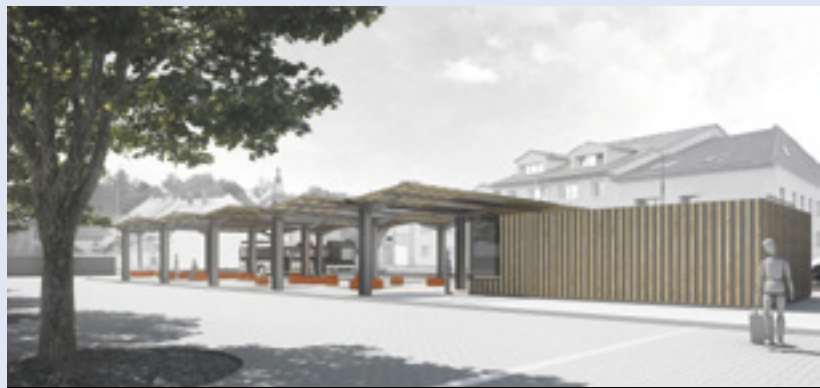
Původní vizualizace rekonstrukce autobusového nádraží

V roce 2014 začala v Soběslavi rekonstrukce náměstí. Již od samého začátku vedení města počítalo pouze s jedinou možnou variantou, a tou je návrh od architekta Jaromíra Kročáka. Jiná řešení mohla být výrazně levnější, než to, které je právě realizováno. Že je projekt rekonstrukce náměstí plný chyb, bylo zřejmé již od začátku, kdy se musely předělávat bezbariérové nájezdy na obrubníky. Také autobusy se nemohou vejít do zatáček vedoucích z náměstí. Dalšími