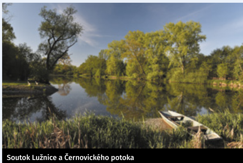
Soutok Lužnice a Černovického potoka

Důvod zamítnutí: Názor jednoho z našich radních mluví za vše. Náměstí jsou prý od toho, aby se tu lidé setkávali, povídali si, a ne aby běhali po náměstí a koukali do mobilu.