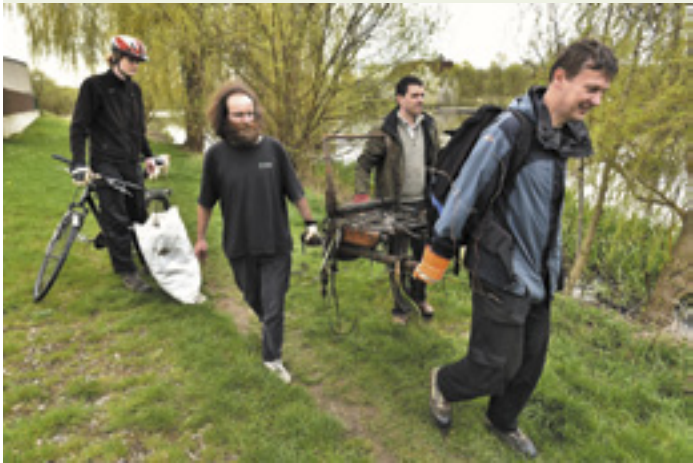
2016 - Úklid břehu Lužnice