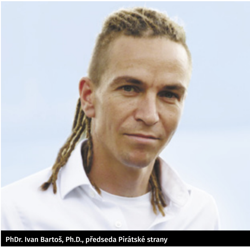
PhDr. Ivan Bartoš, Ph.D., předseda Pirátské strany