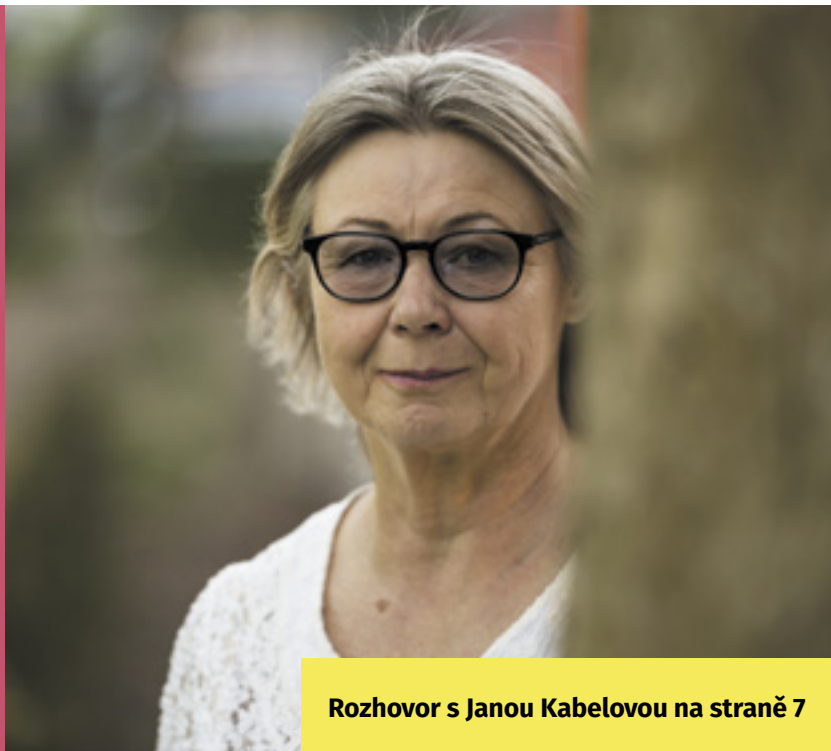
Rozhovor s Janou Kabelovou na straně 7