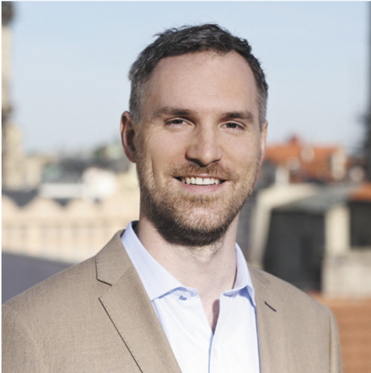
MUDr. Zdeněk Hřib, kandidát Pirátů na primátora hl. m. Prahy