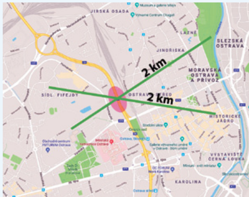
Plánované propojení dvou oddělených částí jednoho městského obvodu