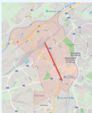
Bariéra rozděluje městský obvod na dvě části

„Území obvodu Moravská Ostrava a Přívoz (MOaP) je od severu k jihu zhruba v polovině rozděleno neprostupnou bariérou v podobě železniční trati a ulice Místecké.