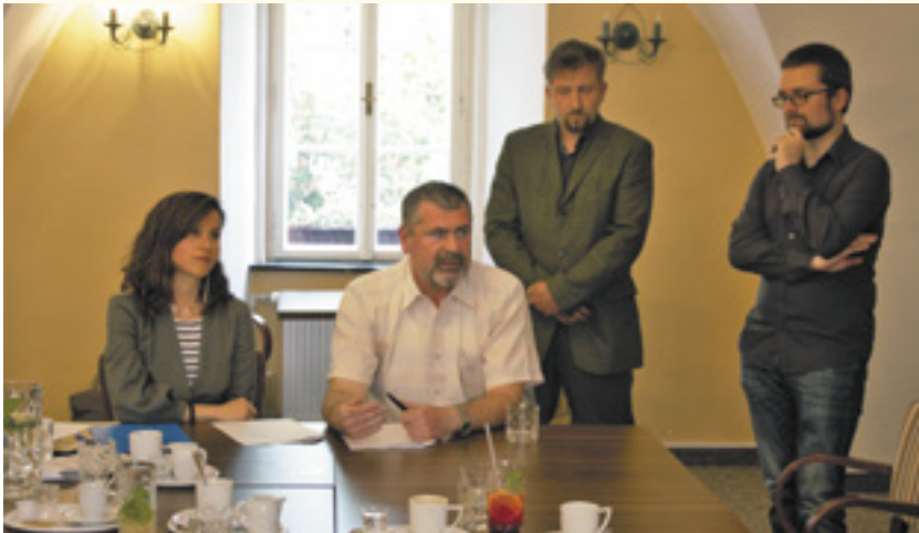
Mikuláš Peksa a Lenka Simerská na společné tiskové konferenci

24. dubna se v prostorách grandhotelu Salva uskutečnila tisková konference místního litoměřického sdružení České pirátské strany a Strany zelených, na níž oba politické subjekty podepsaly koaliční smlouvu a představily zástupce společné kandidátky do blížících se komunálních voleb.