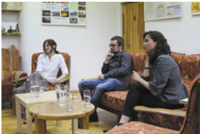
Fotografie ze společné besedy Pirátů a Zelených.

Za Stranu zelených jsem kandidovala v komunálních volbách a krajských volbách. I před tím byla Strana zelených pro mě jedinou přijatelnou volbou.