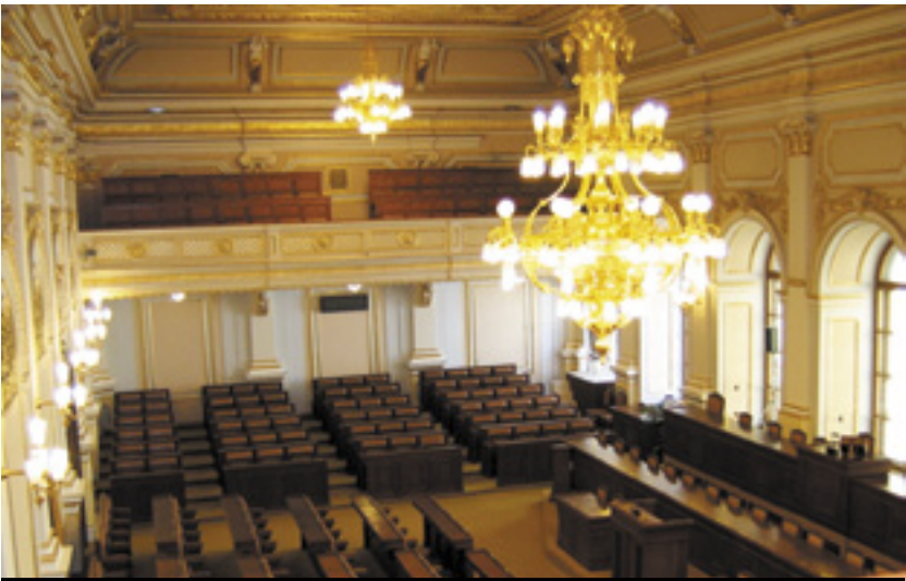
Poslanecká sněmovna Parlamentu České republiky