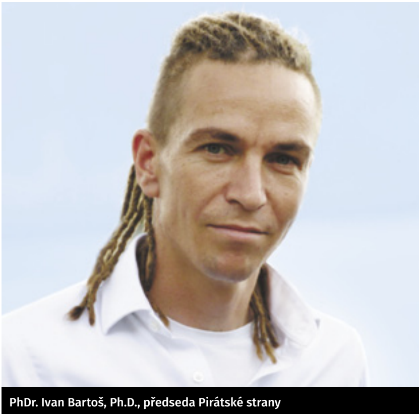
PhDr. Ivan Bartoš, Ph.D., předseda Pirátské strany