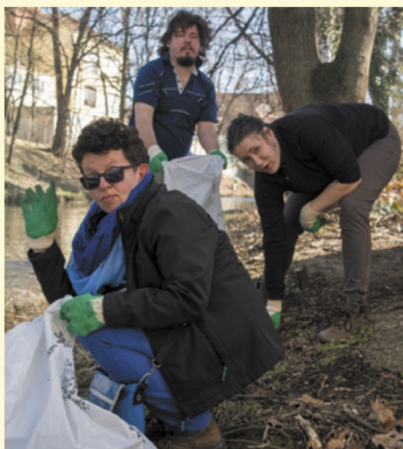
Budějovičtí piráti uklízeli především kolem vodních toků.