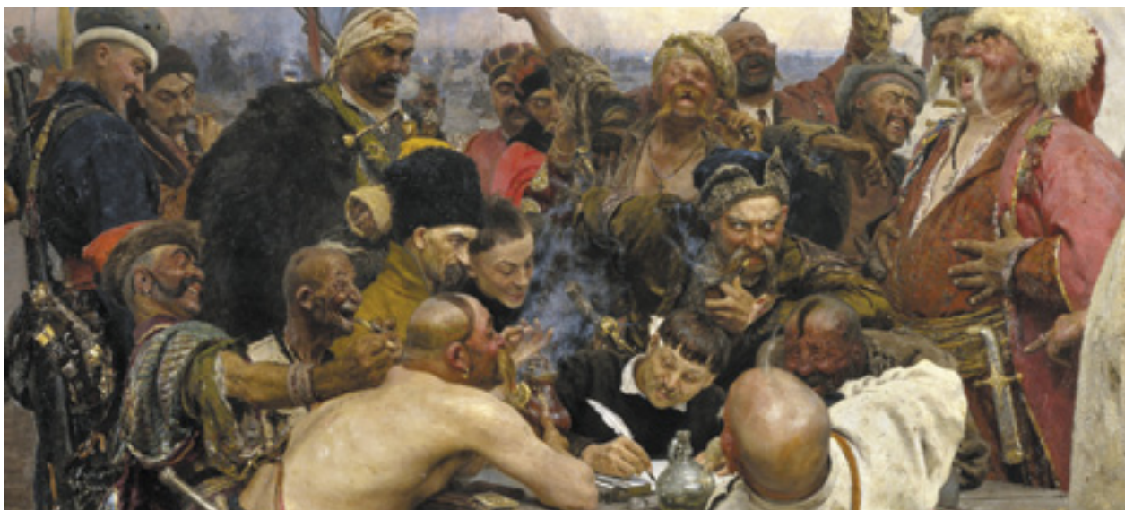
Piráti ostře kritizují praktiky „rodinných trafik“. Nežijeme mezi kozáky. (autor: Ilja Repin)

Důvodně se domníváme, že jedna taková do očí bijící trafika byla v Českých Budějovicích přidělena na konci ledna tohoto roku. Chcete-li, pašalík feudálního stříhu, kde paša předává