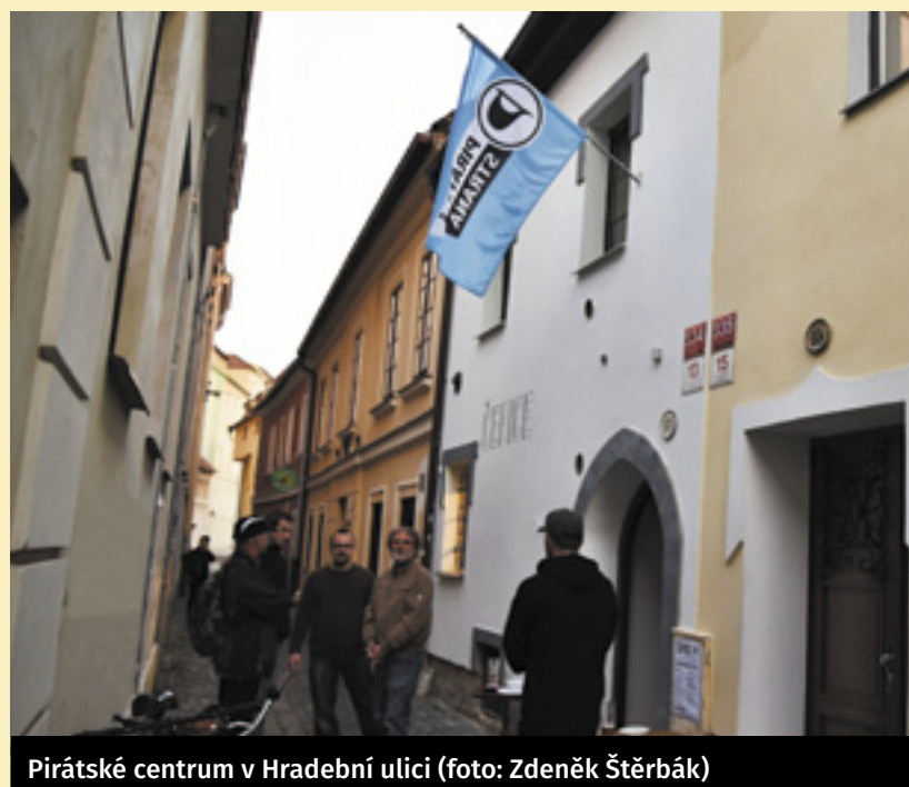
Pirátské centrum v Hradební ulici