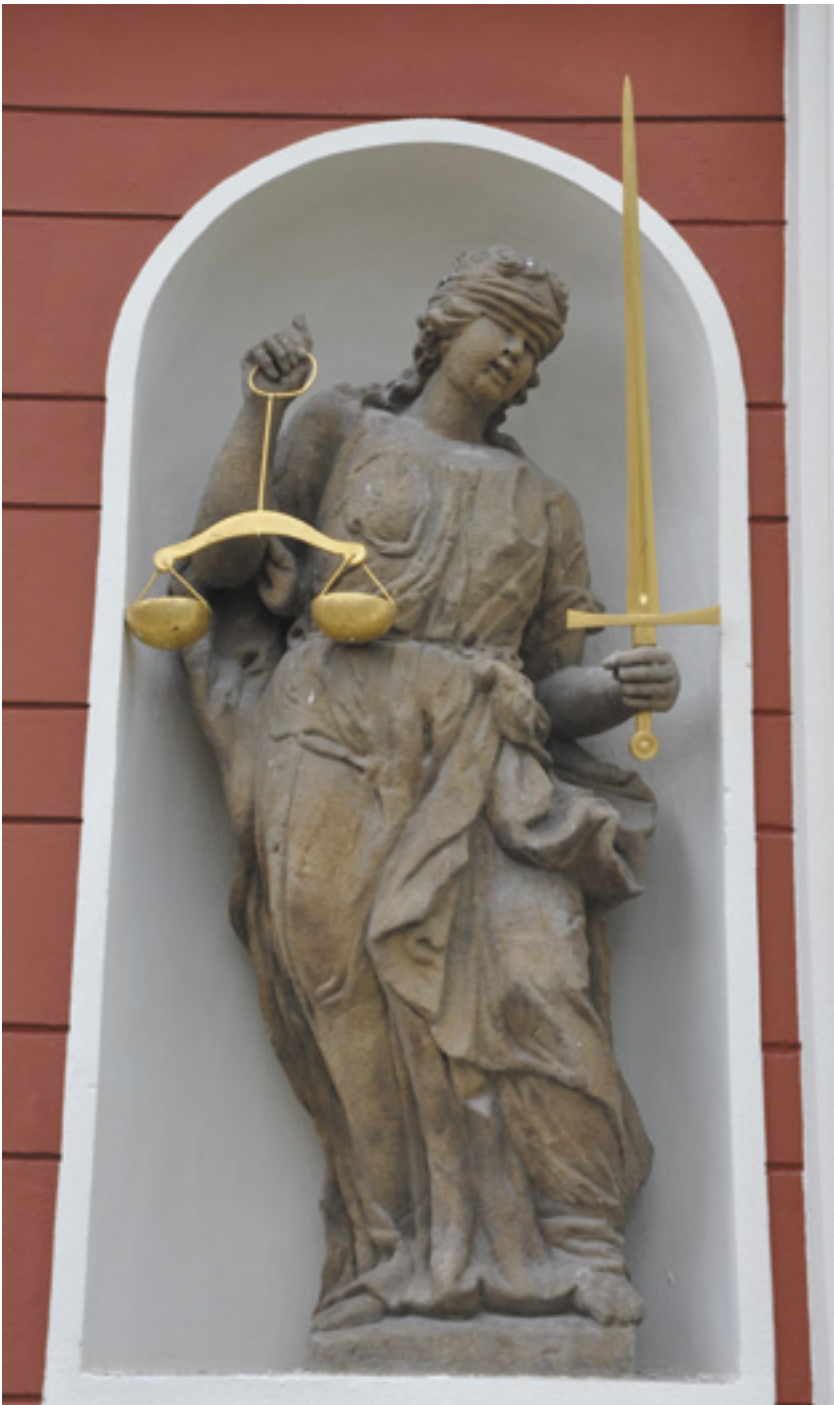
Socha Spravedlností