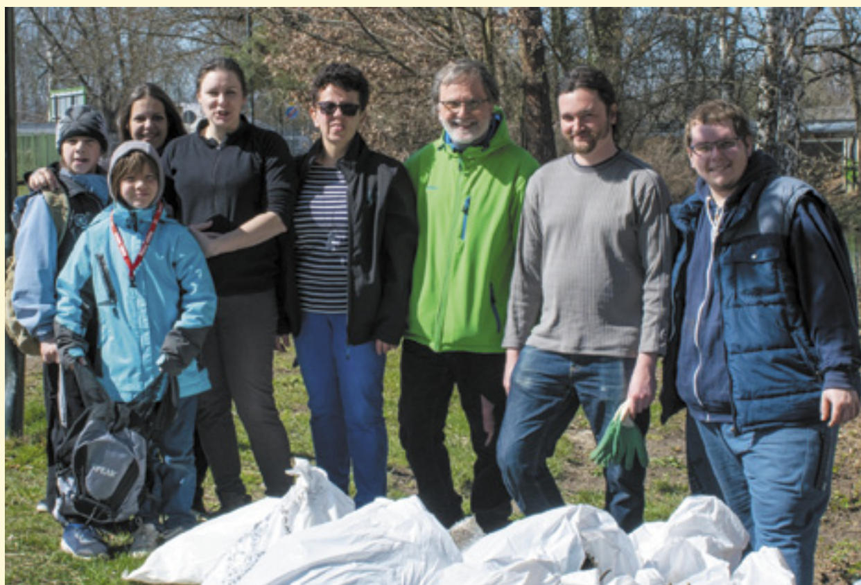
V devíti dobrovolnících sesbírali Piráti v krajské metropoli 150 kg odpadu.